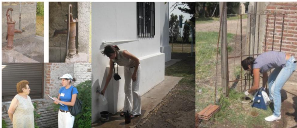
Figura 3. Imágenes tomadas durante el relevamiento de datos (izquierda a derecha): encuesta a residentes de la ciudad de Azul y pozos someros muestreados, toma de muestra de agua subterránea en la ciudad de Tres Arroyos y muestreo de agua subterránea en E. Echeverría.

En este apartado se presentan detalles metodológicos en las diferentes aplicaciones analizadas. En la Figura 3 se presentan imágenes del relevamiento de datos en las distintas aplicaciones.